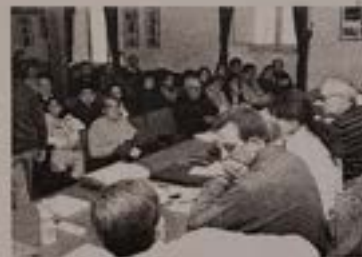
Imagen de la sesión que tuvo lugar en la Sala del Consistorio

Asimismo, en el transcurso de la reunión se procedió al sorteo de dos barcos de Jesús y otros diez de la Virgen, que se subastaron a la subasta de los 38 barcos de cada uno de los pasos. En el caso del Resucitado se alcanzaron los 240 euros mientras que en el de la Virgen del Amparo fueron 140, cifra que se subió en otros a las candidaturas de los últimos años y subió el año siguiente este año.