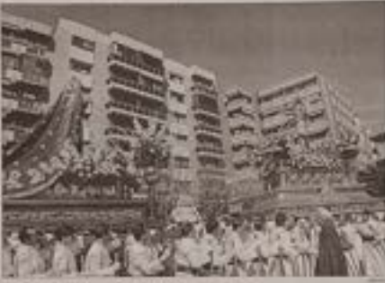
La Hermandad del "Resucitado" celebra este año su cincuenta aniversario.

HERNÁNDEZ La Hermandad de Jesucristo Resucitado y María Santísima del Amparo celebra este año el Cincuenta Aniversario de su constitución. El día 29 tendrá lugar la presentación de un libro, un cd y un vídeo promocional. El día 29 se presentará un libro, un cd y un vídeo conmemorativo. El evento, en la Iglesia de Santa Ana, a las 19:30 horas.